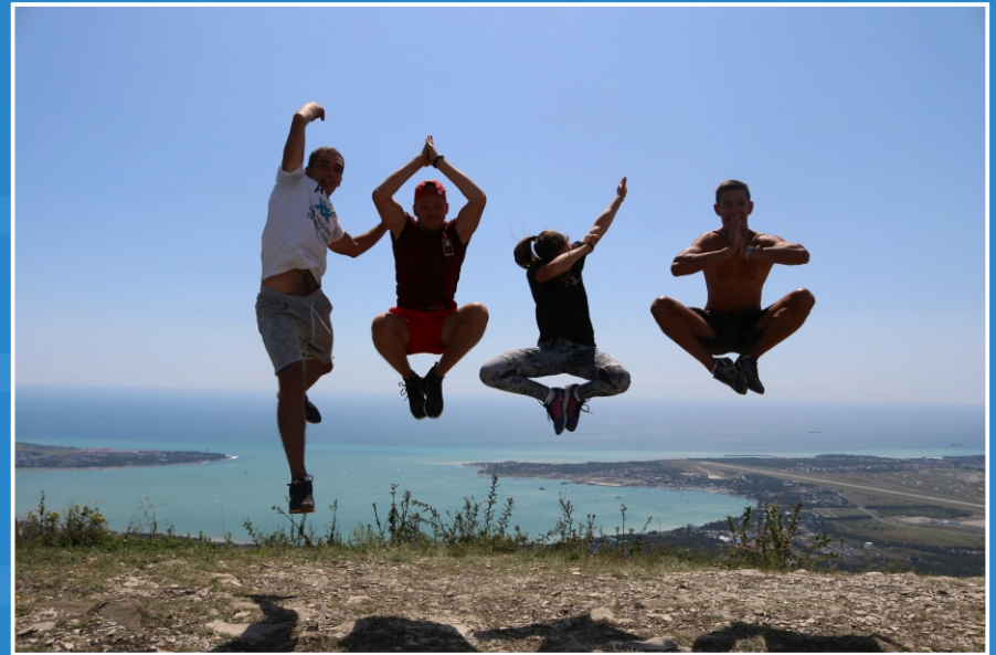
Поход в горы