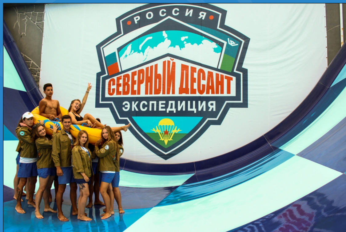
С Серво «Содействие», 2019 год