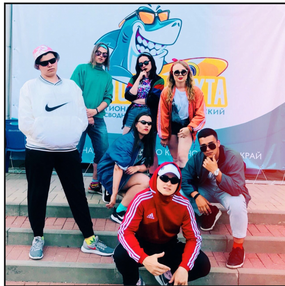
ССерво «Восход», 2018 год