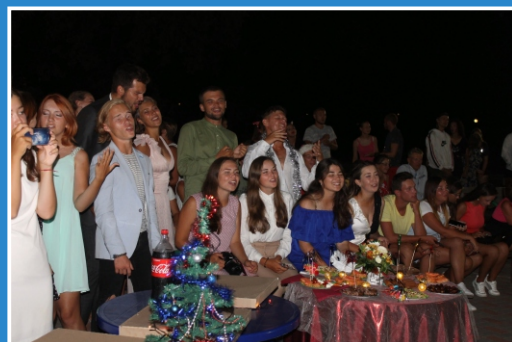
Целинный Новый Год