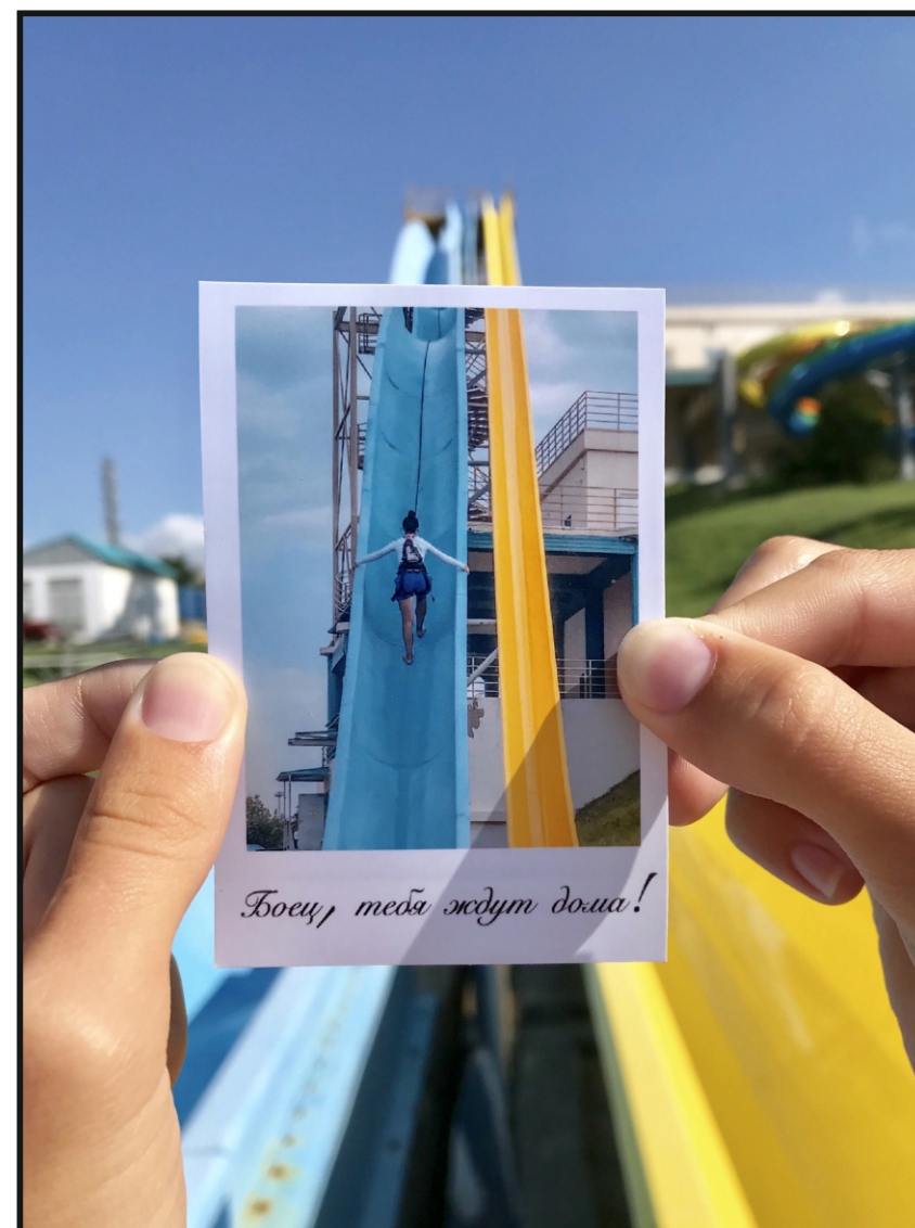
ССерво «Оксюморон», 2019 год