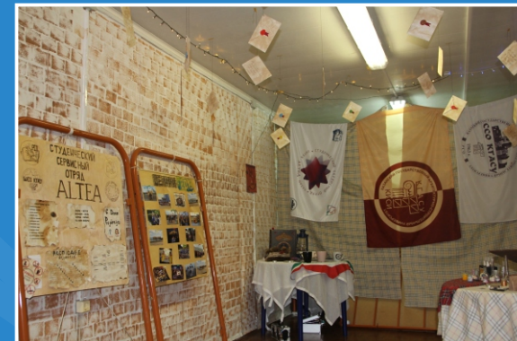
Конкурс целинных лагерей