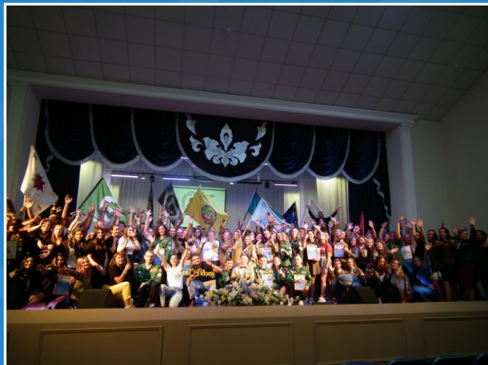
Открытие ВСССерво «Золотая Бухта»