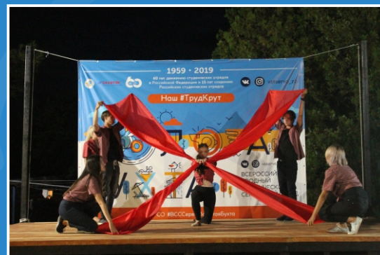
Конкурс отрядных визиток